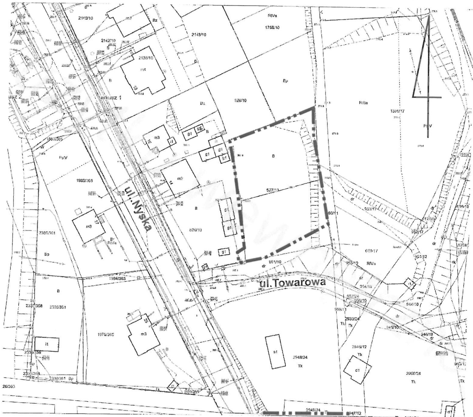
GRANICA ZMIANY PLANU S.1:1000

Załącznik Nr 2 do uchwały Nr ..... Rady Miejskiej w Prudniku z dnia 17 sierpnia 2020 r.