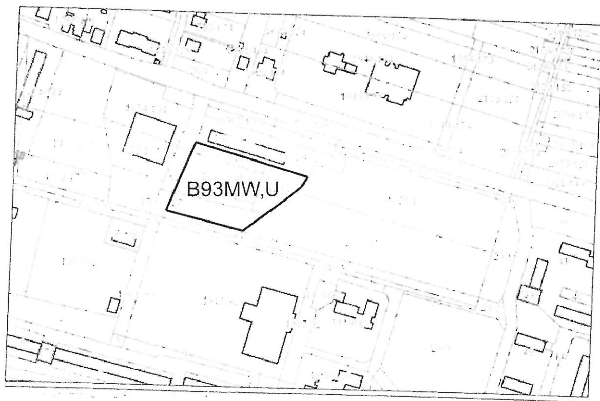
Granica opracowania zmiany planu

Załącznik Nr 2 do uchwały Nr ..... Rady Miejskiej w Prudniku z dnia ..... 2019 r.