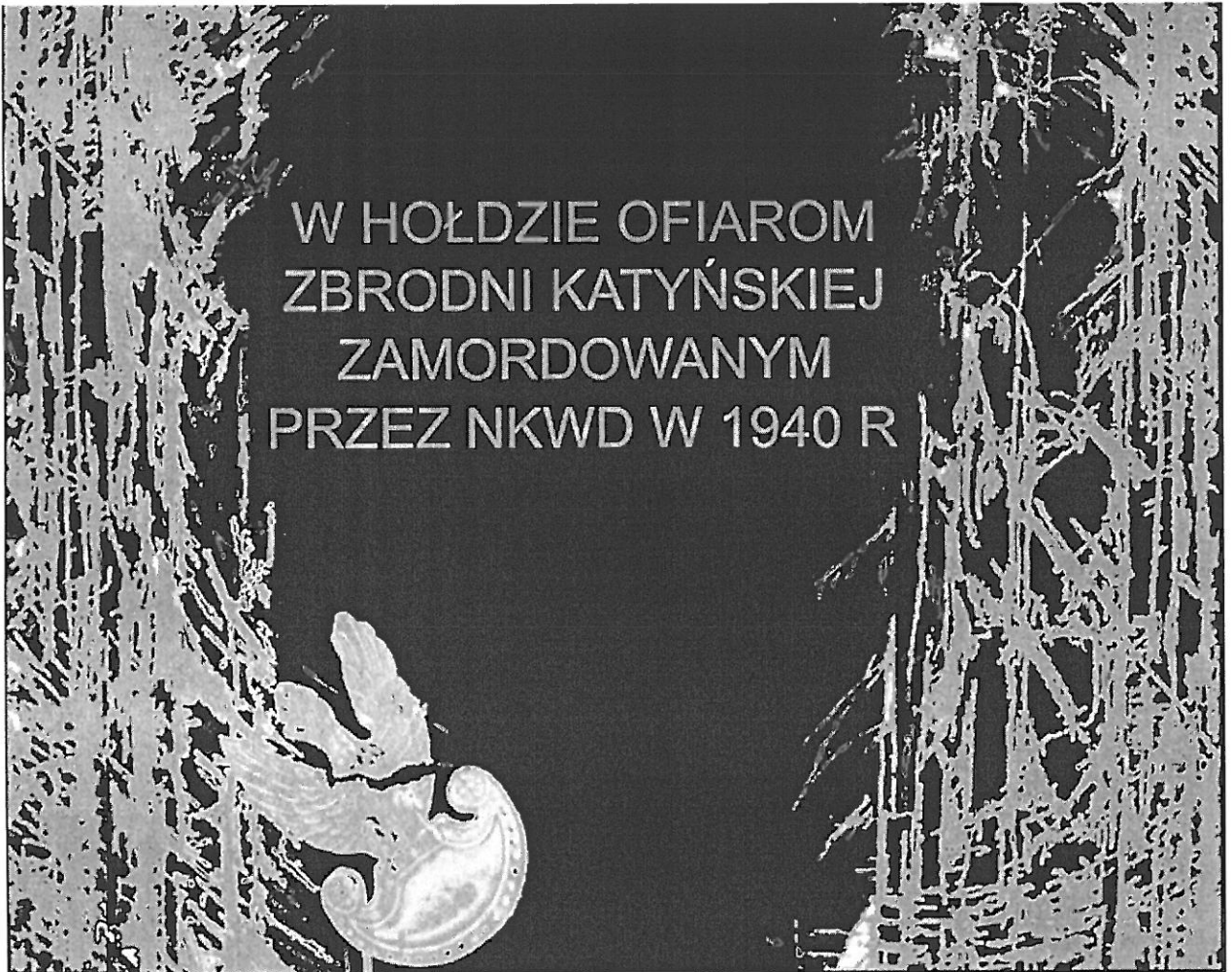
tablica pamiątkowa o wymiarach 100 cm x 80 cm

Załącznik Nr 1 do uchwały Nr ..... Rady Miejskiej w Prudniku z dnia 27 marca 2023 r.